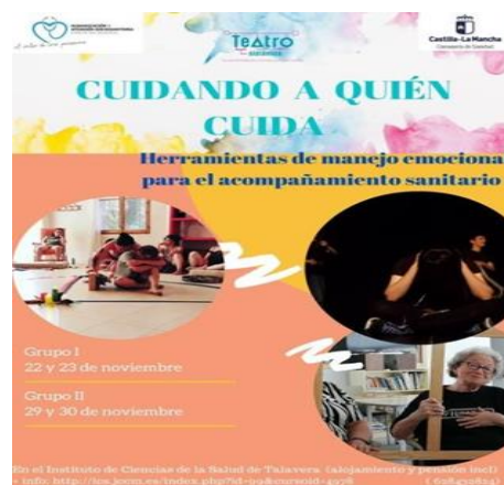
Seminario Taller- ICS.